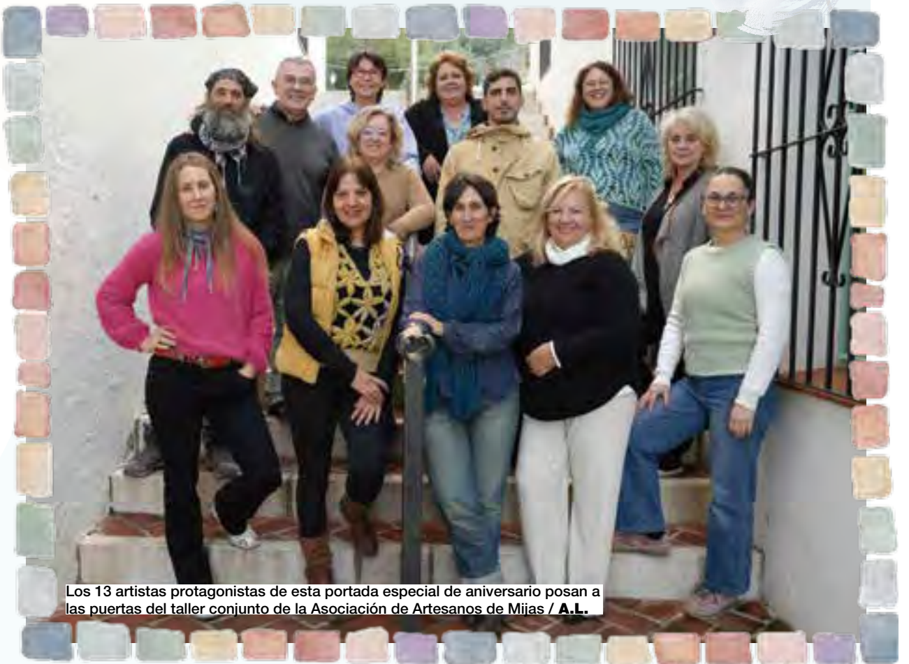
Los 13 artistas protagonistas de esta portada especial de aniversario posan a las puertas del taller conjunto de la Asociación de Artesanos de Mijas