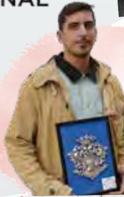
Amador Angulo Platería-Orfebrería